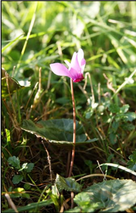
Überstrahlungen in der Blüte