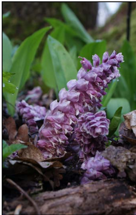
Die Pflanze ist gut aus dem Kontext gelöst. Der Hintergrund ist allerdings sehr unruhig