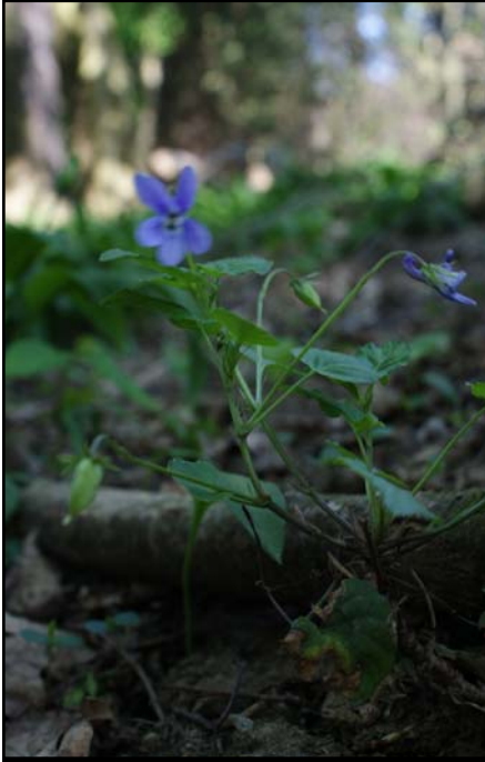
Unschärfe durch Wind