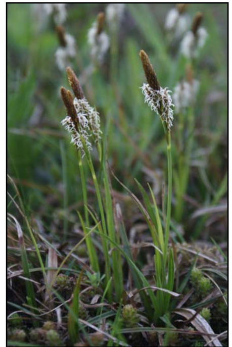
Die Pflanze ist aus dem Kontext gelöst und steht vor einem harmonischen Hintergrund