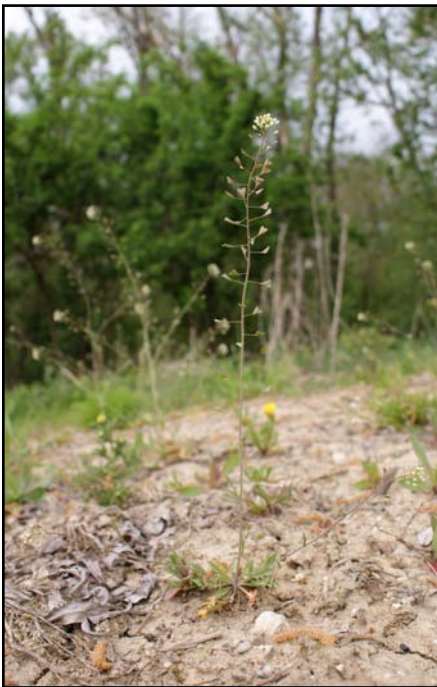
Die Pflanze ist nicht aus dem Kontext der Umgebung gelöst und der Hintergrund ist sehr unruhig