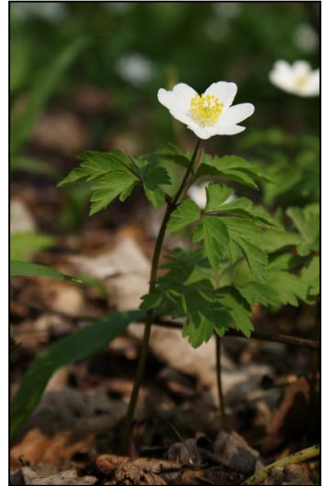
Die Pflanze ist annähernd gleichmäßig ausgeleuchtet