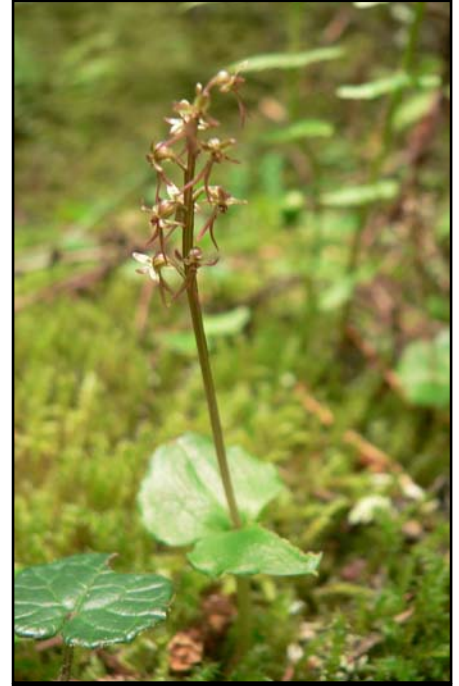
Unschärfe durch schlechte Lichverhältnisse (zu lange Belichtungszeit ohne ein Stativ)